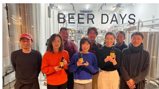
完成した”UME CRAFT”の試飲会を幕張ブルワリーにて開催。横芝光町宿泊組合の皆様と。