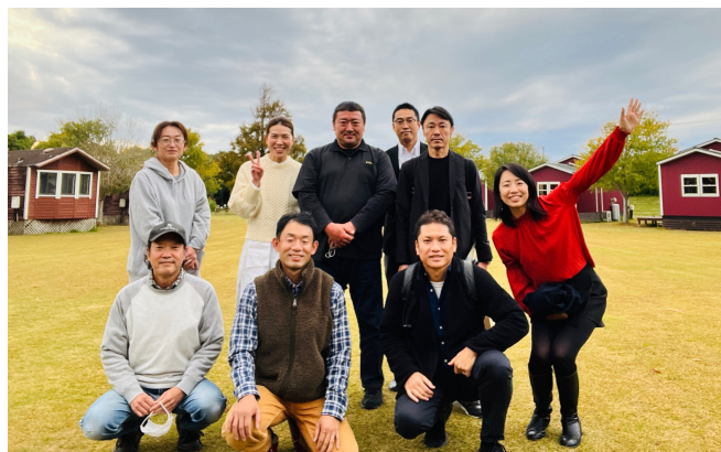
横芝光町宿泊組合の皆様と、Co-Design CHIBAメンバー

町では、樹齢70年の梅の木を町の観光資源として守り育てるため、2015年より梅林保全事業を実施しています。